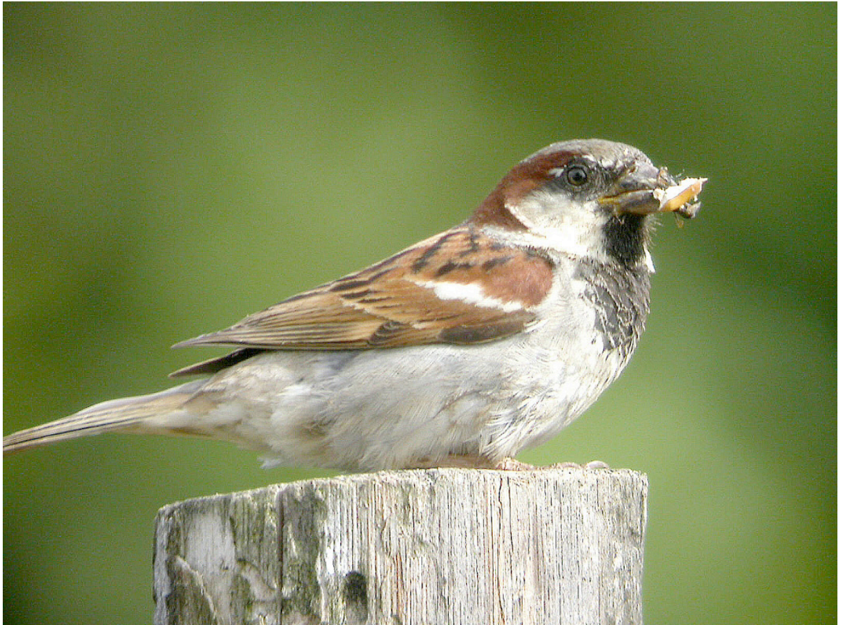
Mâle de Moineau domestique.