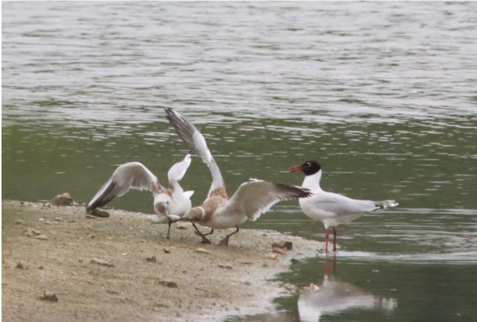
Photo 7 : scène de dispute mettant en évidence les rémiges primaires externes.

Le second individu a moins de caractéristiques tranchées, mais on notera le pattern sombre marqué sur la partie distale des couvertures moyennes.