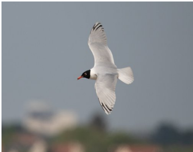
Photo 3 : Mouette mélanocéphale de 2 e été, à Charny — 77.

Une variabilité importante existe parmi ces hybrides. Certains ont davantage le phénotype de la Mouette rieuse, comme l'individu décrit par Leray et al. (1999). Des mouettes hybrides sans aucune trace de noir sur les rémiges externes ont aussi été observées en Pologne, la seule indication de leur génétique hybride provenant de leur baguage au nid (Zielinski et al. , 2019).